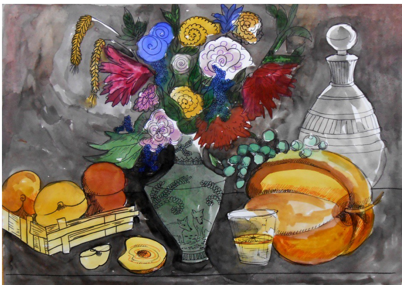
Фото занятия «Декоративно-стилизированный натюрморт по мотивам работ И.Т. Хруцкого».