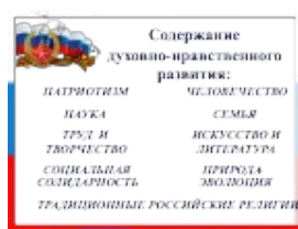
( Слайд 3)

Базовые ценности должны лежать в основе уклада школьной жизни, определять урочную, внеурочную и внешкольную деятельность детей.