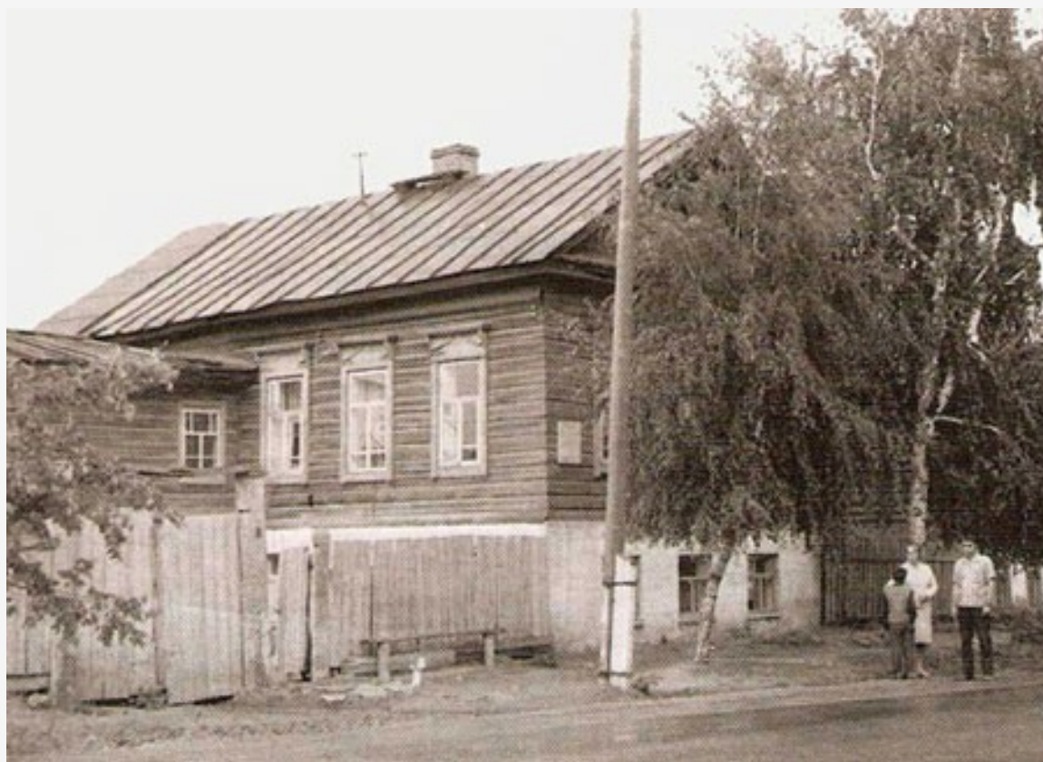
Дом в Елабуге, в котором жила Дурова