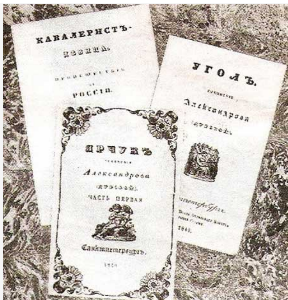
Книги, написанные Надеждой Дуровой