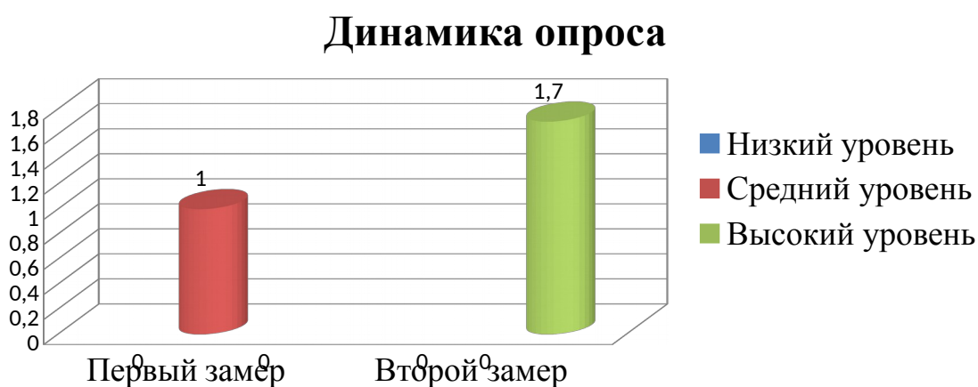
Рисунок 3 – Динамика уровня информированности воспитателей о ценностном отношении к труду детей старшего дошкольного возраста в процессе совместной трудовой деятельности.

В результате сопоставления первого и второго замера опроса воспитателя мы видим положительный результат.