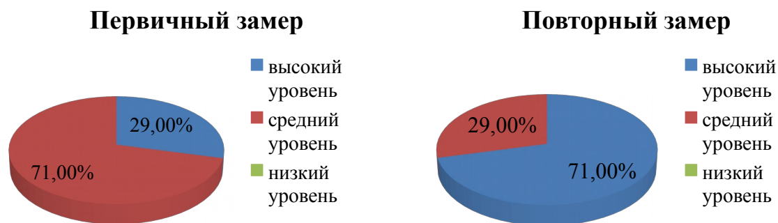
Рисунок 1 – Количественная обработка результатов первичного и повторного замера уровня сформированности ценностного отношения к труду детей старшего дошкольного возраста

деятельности; доброжелательно распределяют работу, взаимодействуют с другими детьми. 2 респондента – 29% имеют средний уровень – это свидетельствует о том, что дети охотно принимают и включаются в трудовую деятельность, проявляют старательность в выполнении трудовых действий. Охотно включаются в коллективные формы трудовой деятельности, но выполняют, роль помощников.