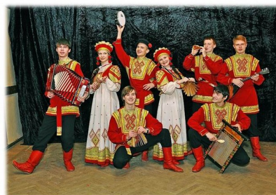
Оркестр народных инструментов