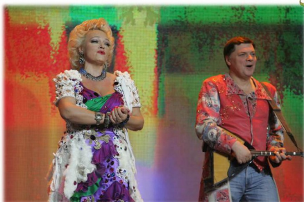
Ансамбль «Золотое кольцо»

Фольклор - художественная коллективная творческая деятельность народа, отражающая его жизнь. Это песни, пословицы, прибаутки, загадки, костюмы, обряды и обычаи.