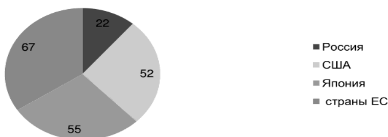
Рис.2. Доля малого бизнеса зарубежных стран в составе ВВП, %

Основная проблема, с которой сталкиваются многие российские предприниматели, связана с недостатком финансирования, что особенно ощущается в большинстве регионов России. В свою очередь, реализация потенциала малого бизнеса в решении экономических и социальных проблем невозможна без рационально разработанной финансово-кредитной поддержки.