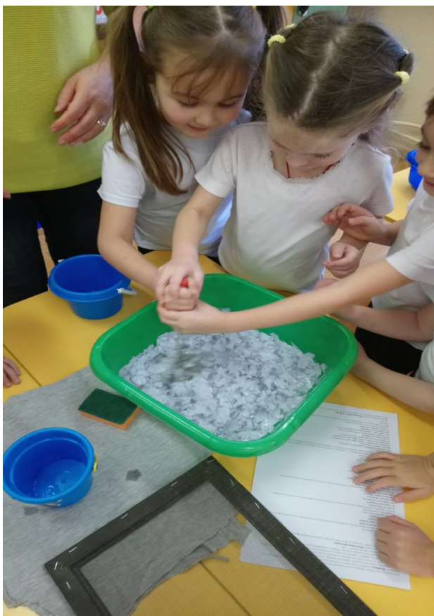
5. Беседа «Раздельный сбор мусора».