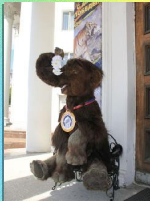
Музей Ледниковый период