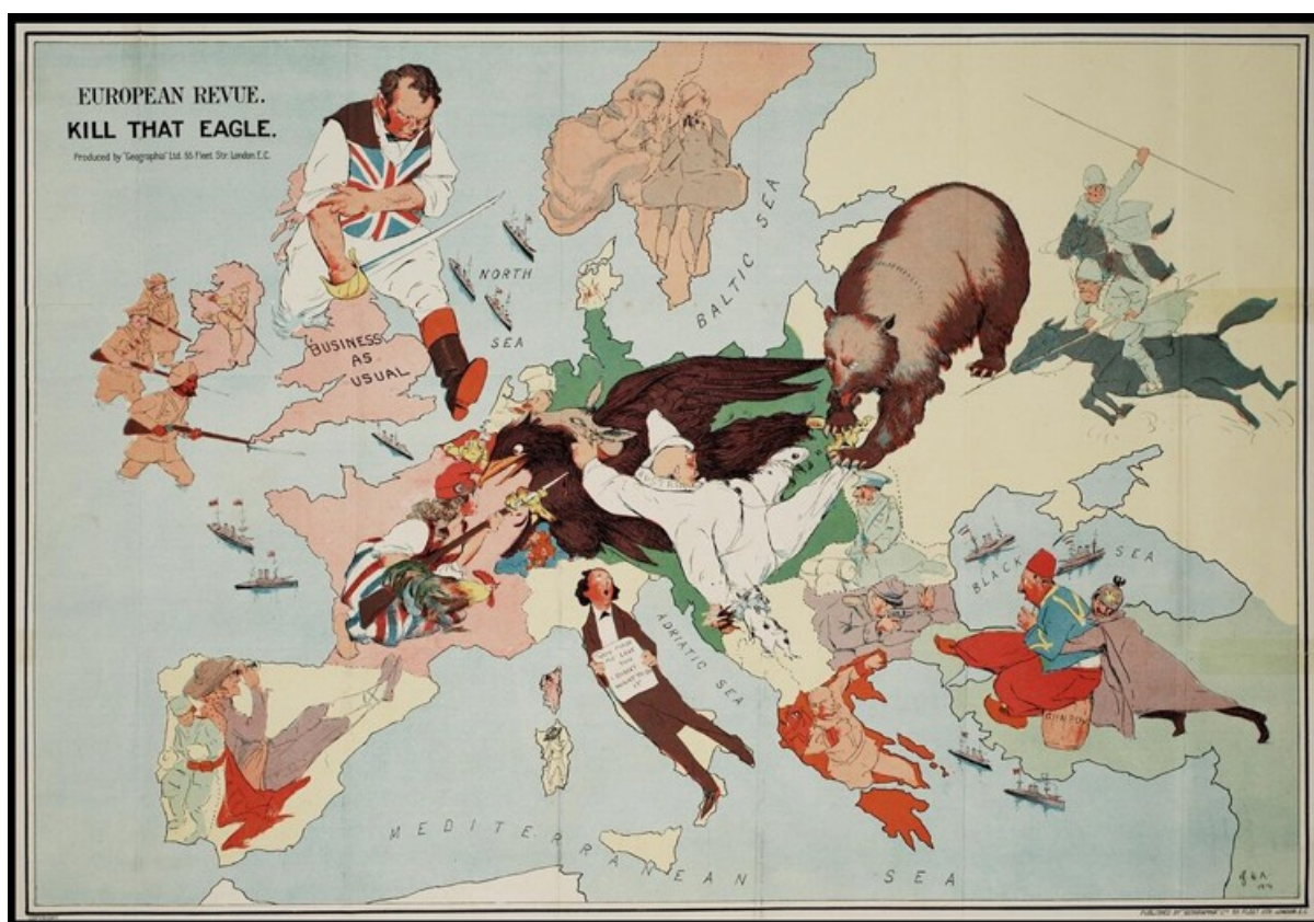
Карты - карикатуры первой мировой войны

Российская империя, как правило, изображалась в образе злого (иногда простодушного) сельского мужика или медведя, устремившего свой «хищный» взор на Центральные державы.