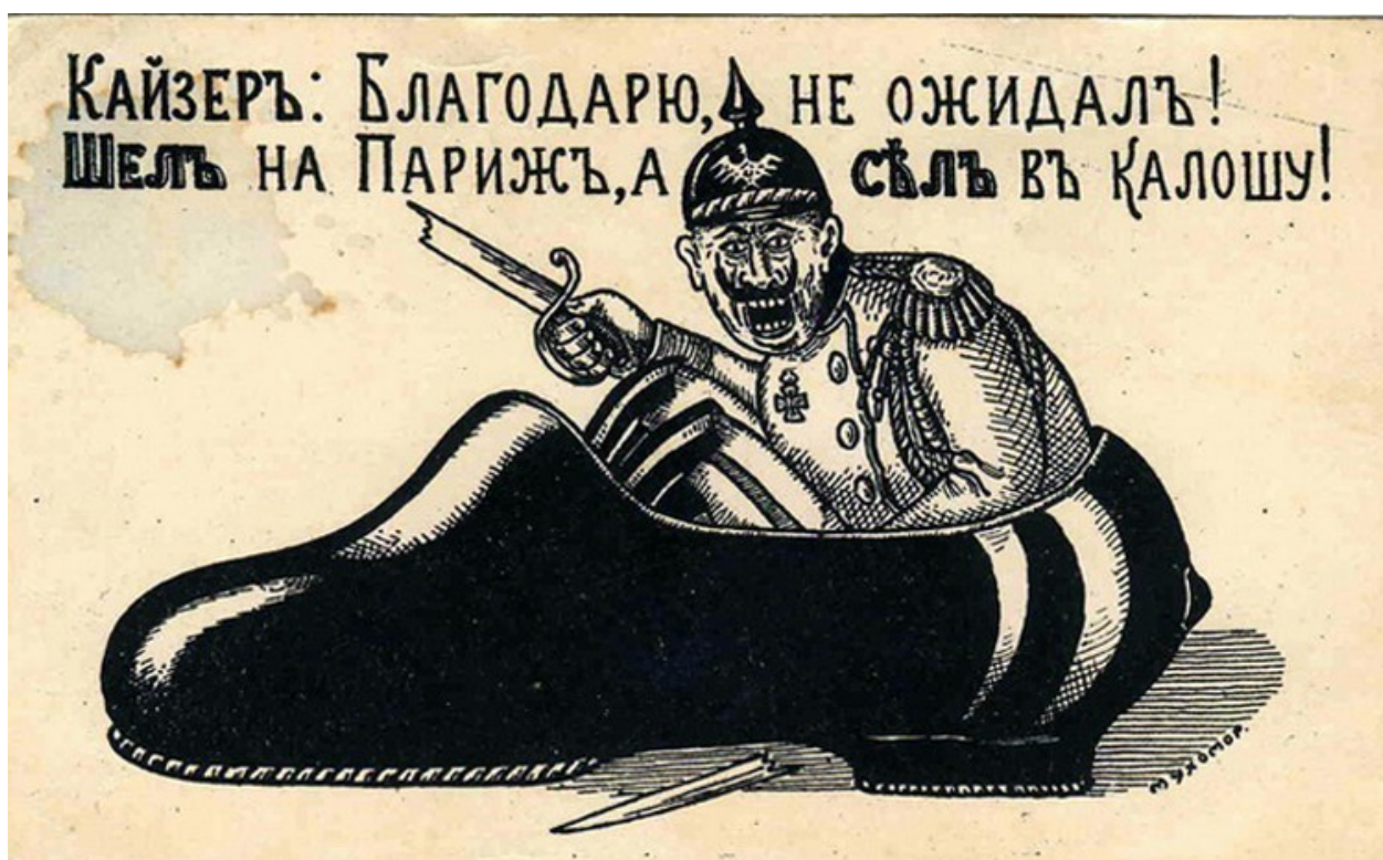
Карикатуры первой мировой войны

Характерной чертой российских карикатур было отображение побед союзников. Карикатура 1914 г. демонстрирует неудачное наступление немцев на Париж. Германия, представленная кайзером Вильгельмом II в образе лисы, получила отпор от французской артиллерии 10 .