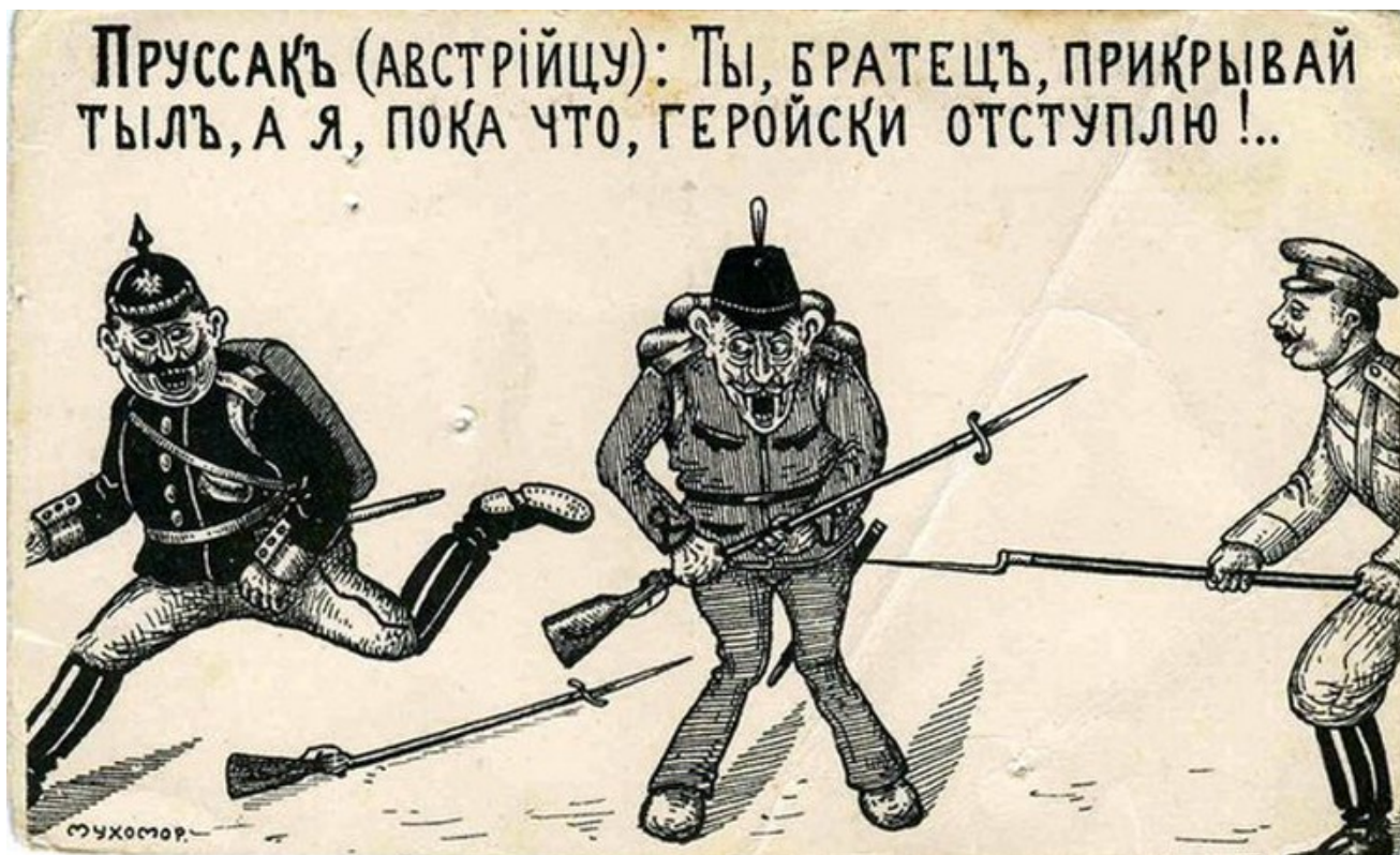
Карикатуры первой мировой войны

Чтобы показать отсталость российской армии, немцы порой сравнивали ее с гуннами. Некоторые плакаты, на которых были изображены царские солдаты, сопровождались надписями «Гунны идут!» или «Эти варвары». Примечательно то, что в странах Антанты немцев также сравнивали с гуннами и часто называли варварами.