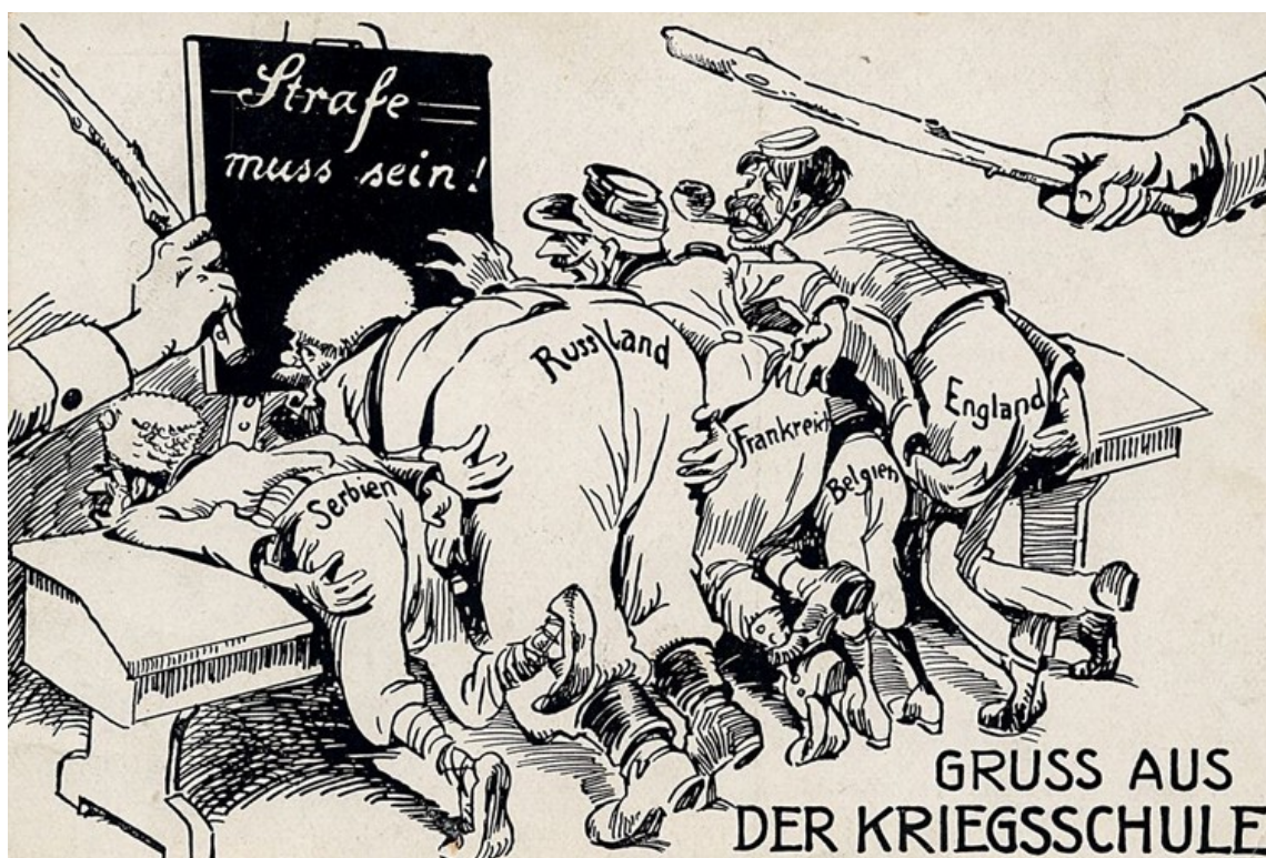
Карикатуры первой мировой войны

Карикатуры периода Первой мировой войны в России и Германии имели разнообразные образы и создавались с различными целями. Но все же для всех из них были общие характерные черты. В карикатурах Германской империи по отношению к России преобладали негативные оценки. Российскую империю представляли бескультурной, отсталой и агрессивной. Русским приписывались такие черты, как жестокость, бессовестность и свирепость 7 .