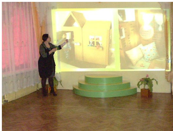
Изучение Интернет-ресурсов на тему «Поделки из картонных коробок»