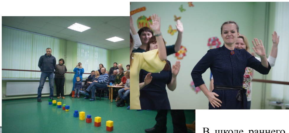
В школе раннего разви-