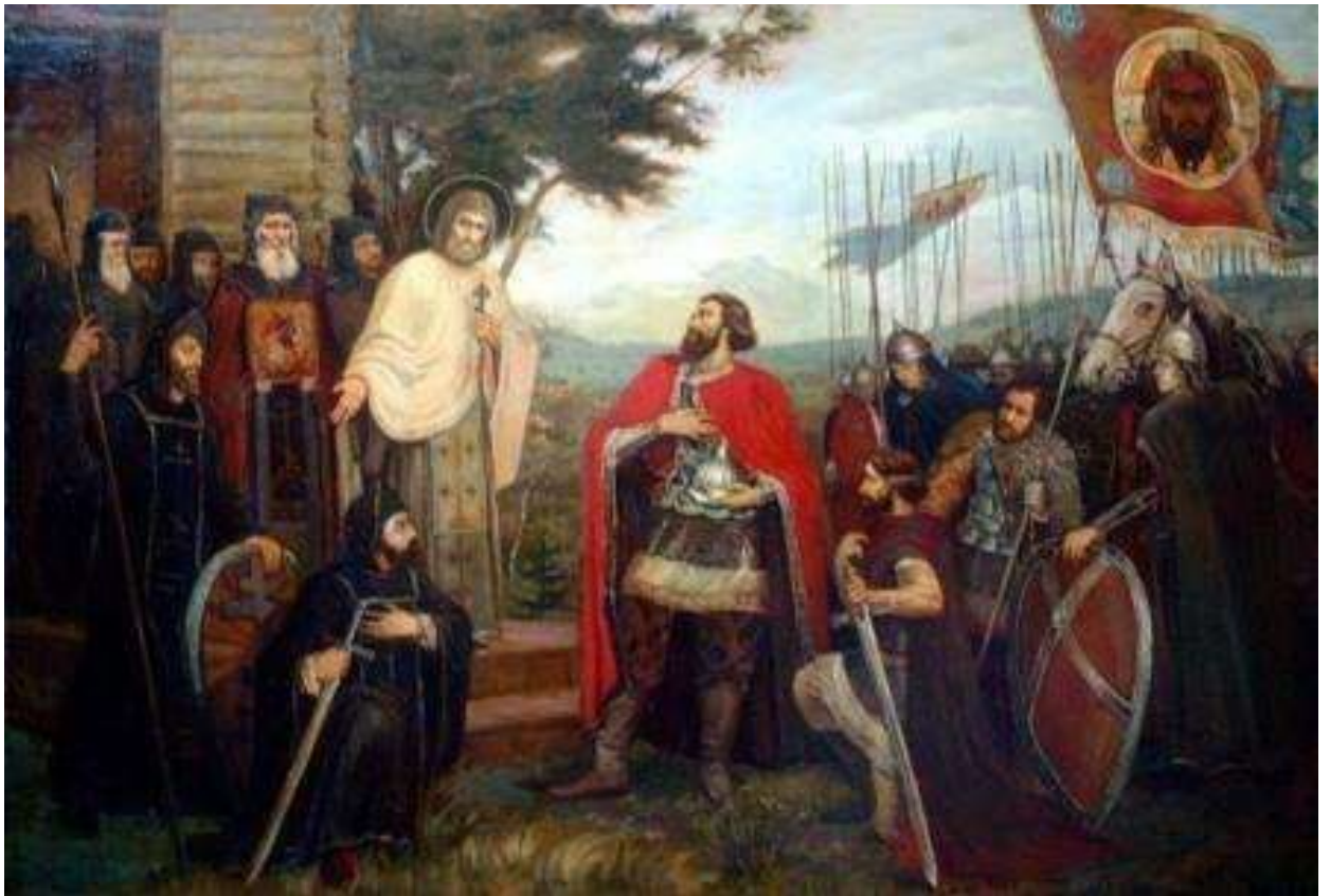
Картина “Сергий Радонежский благословляет Дмитрия Донского на битву”.