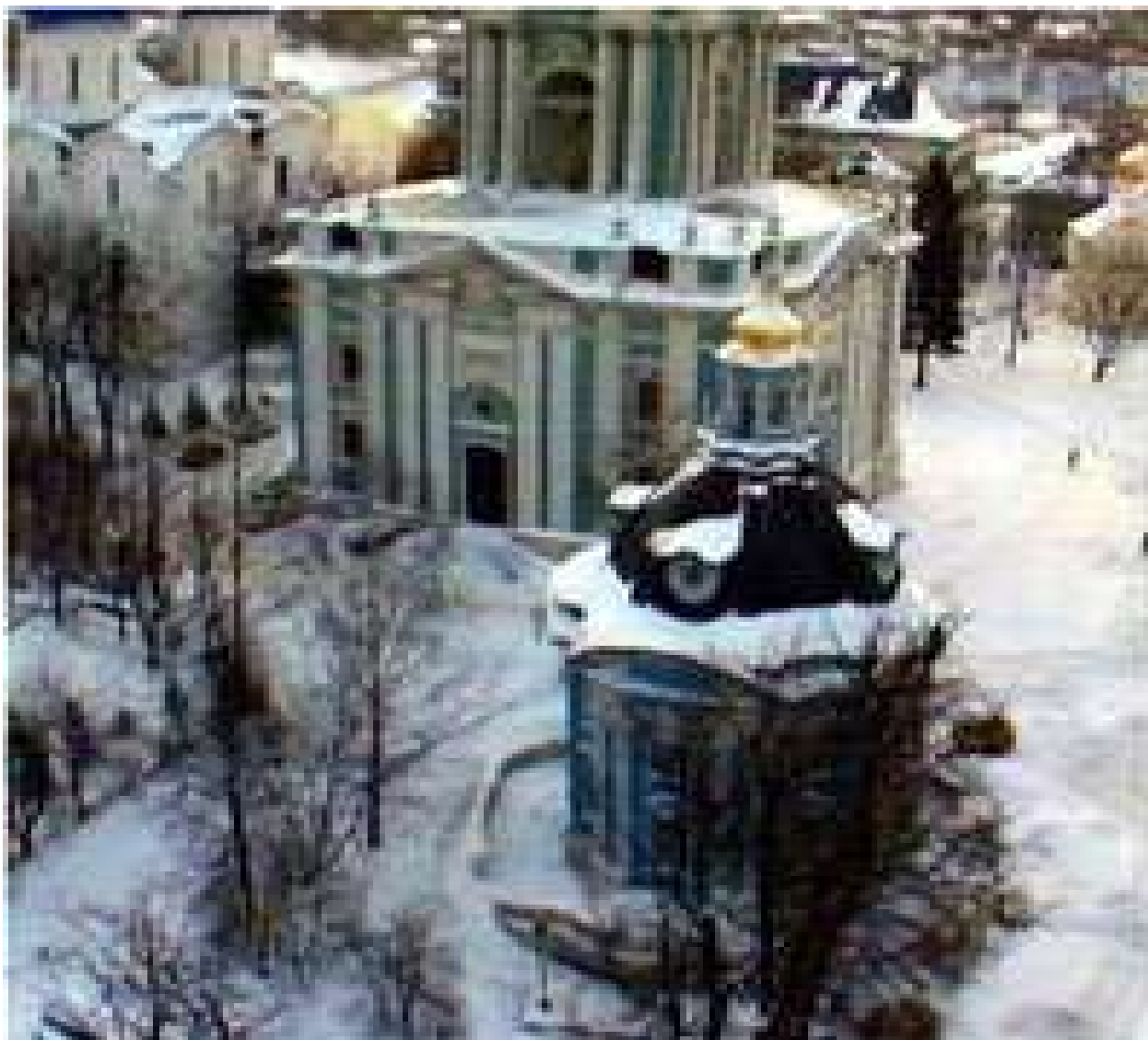
Церковь Божией Матери «Одигидрия» (Смоленская)

Маленькая церковь с одной главою овальной формы.