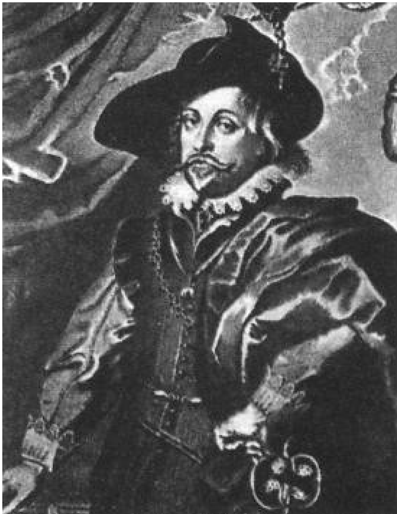
Польский королевич Владислав