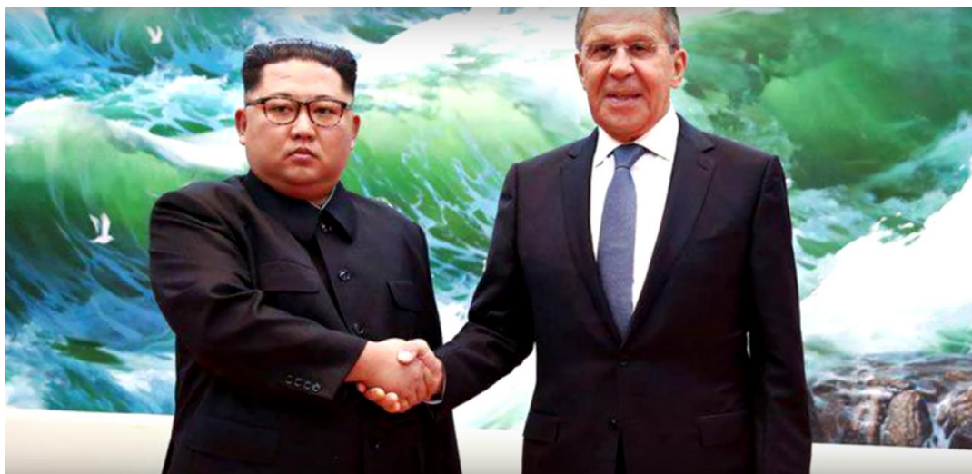
Рис. 1 – оригинальное фото со встречи политических деятелей

7. Применение фотошопа. Для того, чтоб создать диаметрально противоположное мнение у российских зрителей о встрече Высшего руководителя КНДР Ким Чен Ына и с главой МИД РФ Сергеем Лавровым, специалисты телеканала на фотошопе создали улыбку Ким Чен Ыну.