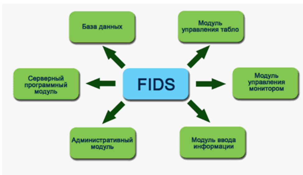
Рис. 2. Состав программного комплекса