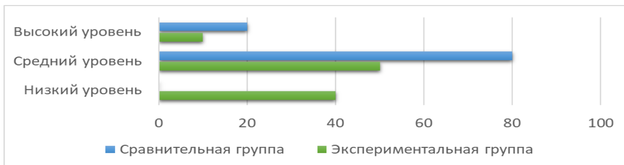
Рис. 2. Уровень поведенческой активности у участников экспериментальной и сравнительной групп (в %)

Обследование поведения детей старшего дошкольного возраста, с целью выявления особенностей, показало, что некоторым детям с ЦП свойственно безразличное отношение к неудачам сверстников. Дошкольники обидчивы, пассивны, не подчиняются требованиям взрослых.