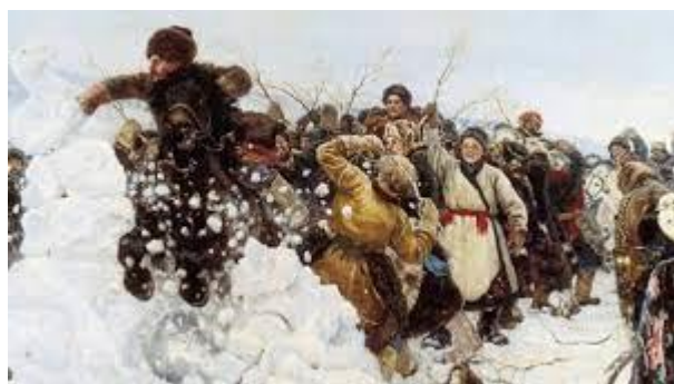
«Взятие снежного городка». Василий Иванович Суриков. 1848-1916г.

Картины Сурикова посвящены народной жизни. Его полотна ценят за реалистичность, яркие детали и внимание к каждому герою. «Взятие снежного городка» - одна из самых известных картин великого художника. Не могу обойти своим вниманием эту картину, хотя она относится скорее к историческому жанру. Русский живописец смог при помощи красок и полотна передать настроение и праздничную атмосферу традиционной игры.